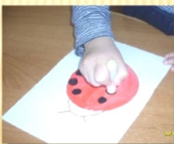
ПОРОЛОНОВЫЙ ТЫЧОК (малый)