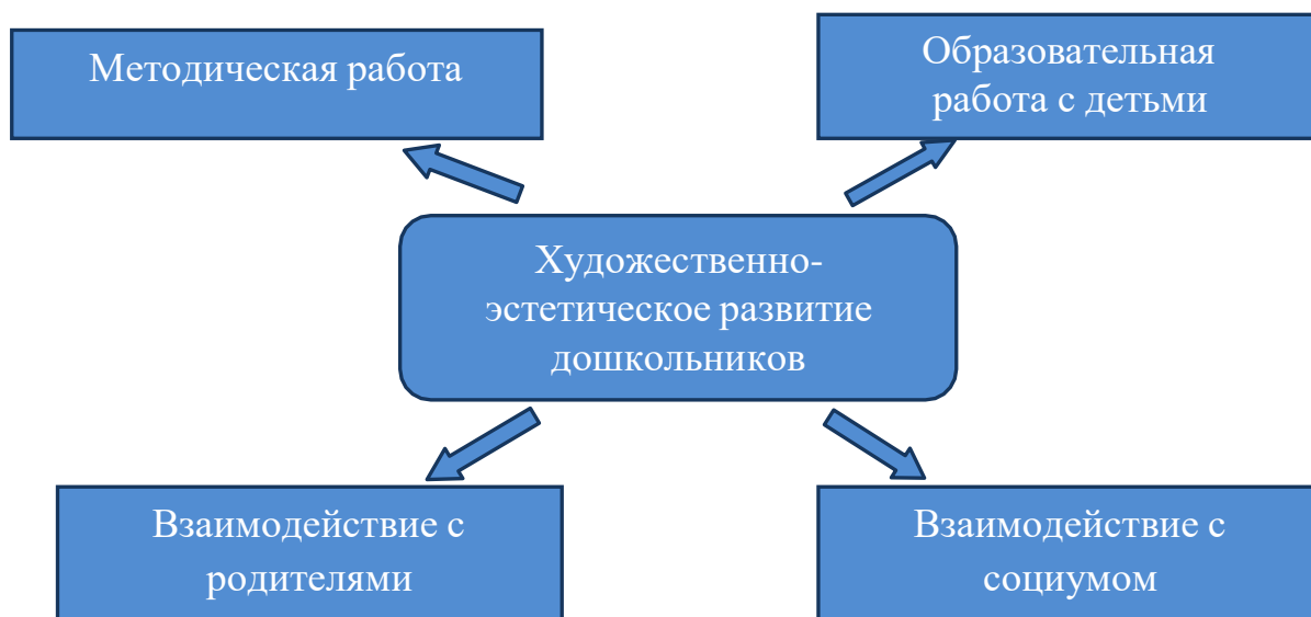
Рис.1. Модель художественно-эстетического развития детей в МАДОУ № 21