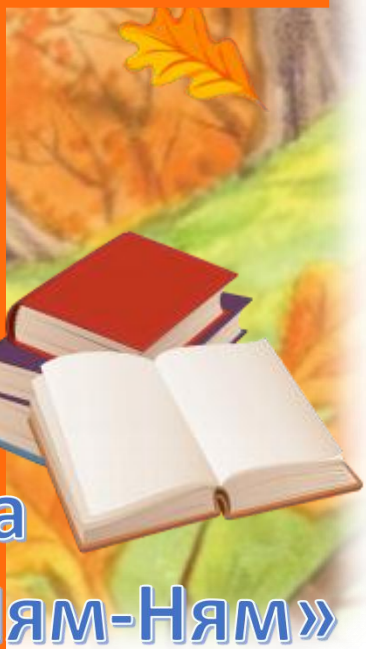
Большая психологическая игра для детей подготовительных групп «Ням-Ням»