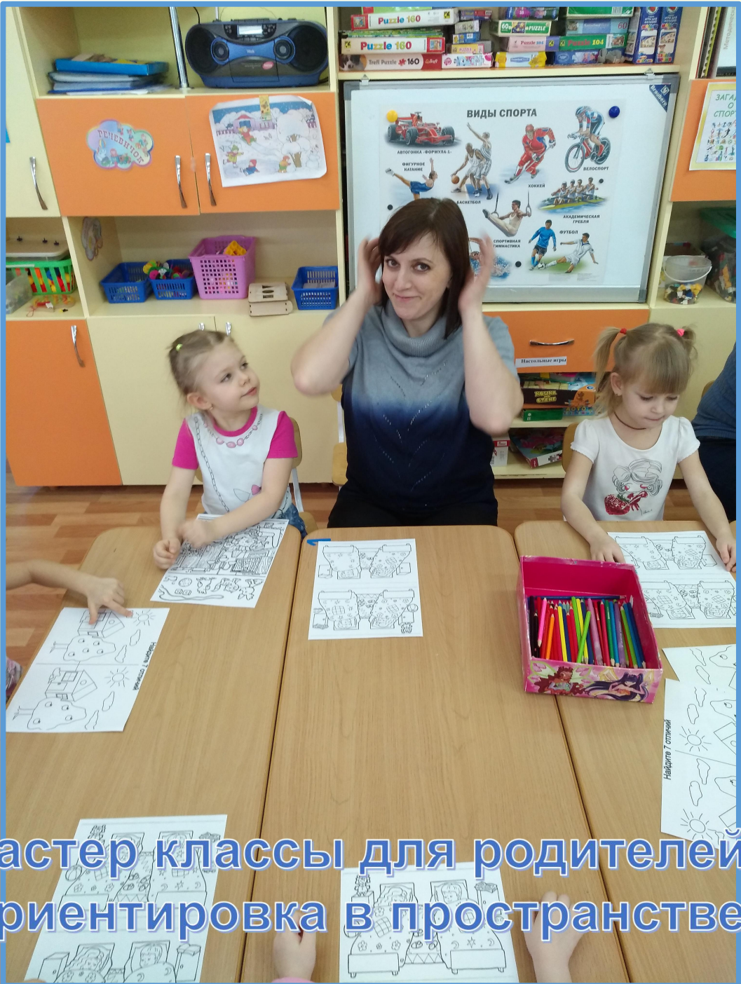
Мастер классы для родителей. Ориентировка в пространстве.